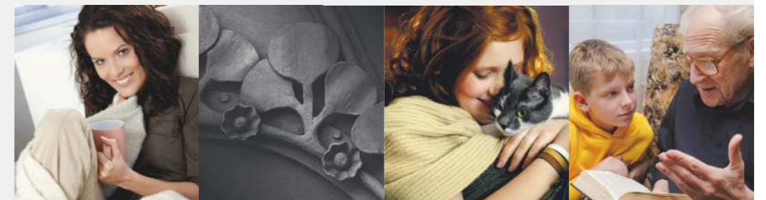
LITINOVÝ ZPLYŇOVACÍ KOTEL NA TUHÁ PALIVA | RUČNÍ PŘÍKLÁDÁNÍ